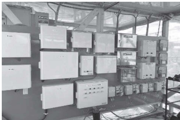
写真3 機器類の制御装置

また、花の開花をコントロールするため、制御性に優れたヒートポンプ、ハウス側面の開閉、遮光カーテン、ミストの噴射換気扇などを、自立分散型環境システムであるユピキタス環境制御システム（UECS）を活用したICT技術により、管理の自動化による夏いちごに最適な生育環境を整えている。