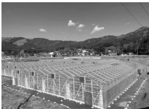
写真1 木骨ハウス全景